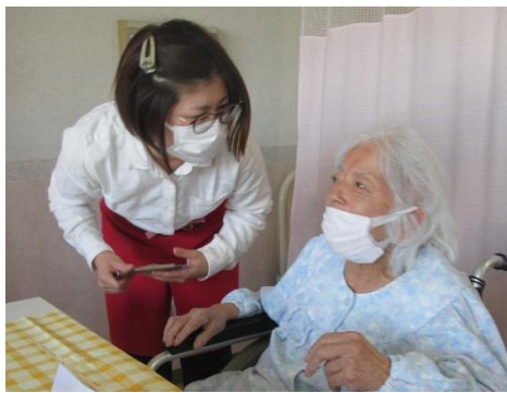
カフェ店員に扮した職員が注文を取ります♪