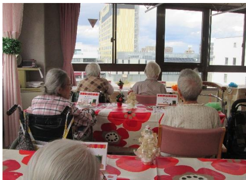
手をつないでお話しました

駅東口の見える部屋が、一日限定でカフェに様変わり！ 新しくなった街並みとLRTを眺めながら、お茶会をしました。